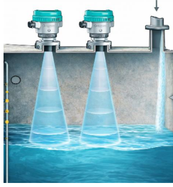
Şəkil 1. Kanalda yerləşdirilmiş LU240 ultrasəs sensoru

Ultrasəs sensorundan daxil olan 4-20 mA analoq siqnal cərəyan-gərginlik çeviricisi vasitəsilə mikrokontrollerin analoq girişlərinə uyğun gərginlik diapazonuna çevrilir. İlk analoq emal mərhələsində filtrasiya və miqyaslama əməliyyatları yerinə yetirilir. Emal olunmuş siqnal mikrokontrollerin analoq-rəqəm çeviricisinə ötürülərək rəqəmsal formaya çevrilir və proqram təminatı səviyyəsində emal olunur.